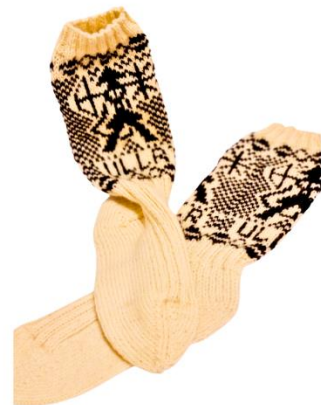
Ullr sokker dam/herre