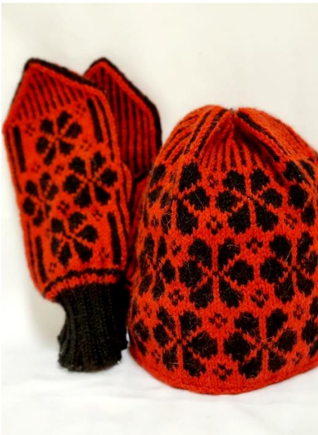
Kisa rose votter og lue dame/herre