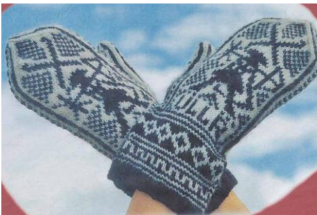
Ullr votter dame/herre

DU FINNER MØNSTER TIL DISSE PÅ HJEMMESIDEN VÅR SOM DU KAN SKRIVE UT: